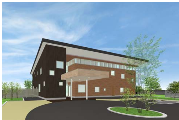
完成イメージ外観パース (北側より)

床 : フローリング 壁 : ビニルクロス 天井 : ビニルクロス 建具 : 木製建具